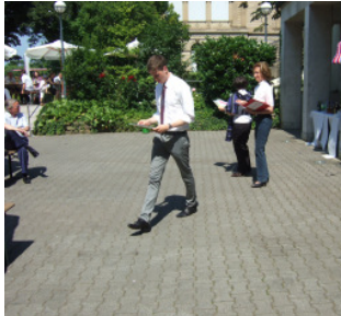
Zertifikat in Händen: Übergabe der Zertifikate der Teilnahme am USA Interns-Programm 2010